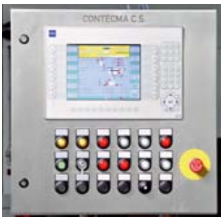
Die Elektroversorgung und -steuerung der modernisierten Zentrifugen basieren auf modernster Technik